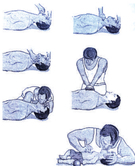
Fig. 1-2. Frymëmarrja artificiale sipas mënyrës “gojë më gojë” dhe “gojë në tub”.

Në mungesë të aparateve të frymëmarrjes artificiale, vecanërisht në kushtet jashtë spitalit, ajo duhet të kryhet duke futur ajrin e ekspiruar të personit që kryen frymëmarrjen artificiale në gojën ose hundën e të dëmtuarit.