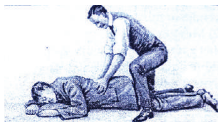
Fig. 3. Respiracioni artificial. Metoda “Schäfer’s”, ekspirimi. Përdoret në rastet me mbytje.

Metoda Schafers’s përdoret në rastet me mbytje. I sëmuri shtrihet