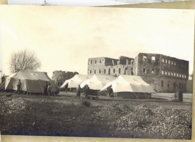
Momente nga veprimtaria e Kryqit të Kuq gjatë Luftës së II-të Botërore.